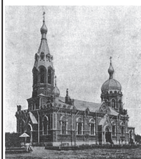
Типова військова церква

Шостка – поселення Глухівського повіту Чернігівської губернії, при станції «Шостка» Києво-Московської залізниці. Учебні заклади: 4-х класне міське та три приходські школи. Шосткинський пороховий завод знаходиться біля поселення. Церква одна – при заводі. Церква заводу на честь Різдва Христового