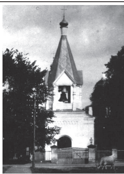
Шостка. 1913 рік

ню, вона переведена у відомство Обер-священника Армії і Флоту. Вміщує церква до 900 чоловік. Дзвіниця поєднана з церквою. Гідна уваги ікона Св. Архистратига Михайла і Великомучениці Варвари, із зображеннями, що оточують її, покрови Гресьв. Богородиця, Св. Сповідника Харитона і Св. Благовірної княгині Ольги, – дар Його Імператорської Вищості Великого князя Михайла Миколайовича в 1856 р. Є приписна (без приходу) Св. Володимирська кам'яна церква на шосткинському кладовищі; побудована в 1885 р. По штату при церкві: священник і дякон. Для священника є казенний будинок. Підготував В. Кириєвський