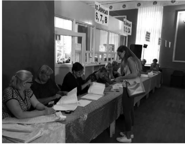
У Шостці в неділю, 21 липня, відбулися дострокові вибори до парламенту.

Виборчі дільниці у Шостці відкрились вчасно. За перебігом голосування під час парламентських виборів стежили міжнародні спостерігачі ОБСЕ. Загалом найбільш активні міста йшли на виборчі дільниці в першій половині дня. Хоча, наприклад, на ту, що розташовувалась на базі Центру культури і дозвілля (кінотеатр Родина) чимало людей завітало за декілька хвилин до закінчення голосування. Люди говорили, що весь день перебували за межами міста і шойно повернулись, відразу поспішили здійснити свій громадянський обов'язок. Як наголосили шосткинці, зі своїм вибором вони визначились відразу. Тому в кабінках для голосування по довгу не затримувались. За їх словами, наша країна потребує чималої кількості змін аби жит-